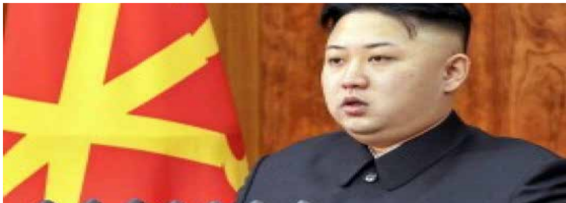
Governo de Kim Jong-Un

Enquanto isso, em meio a caos do governo, cresce perseguição a cristãos no país