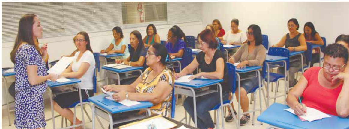
Educação de Jovens e Adultos