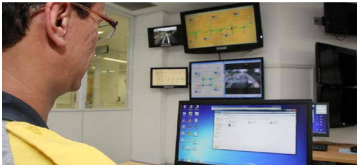
Rede inteligente de semáforos de Barueri é destaque no Valor Econômico