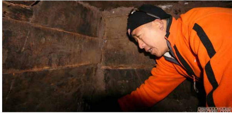
Arqueólogo dentro da arca examinando a estrutura intacta: como disse Jesus "Minha volta será como nos dias de Noé, a arca já foi descoberta. E agora?" É só esperar, Jesus Cristo está voltando.

Achado oceano subterrâneo que confirma de onde vieram as águas do dilúvio, esse achado foi por esses cétricos cientistas e porque não ateus, que continuam duvidando da autenticidade da Bíblia, que Deus tenha misericórdia das almas deles e aí vem o começo do fim e da grande vinda do Senhor Jesus Cristo, tão esperada por todos os que o temem