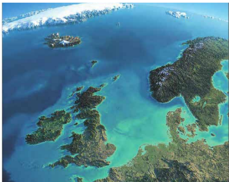
A conceituada revista Science divulga a notícia de que os geofísicos da Northwestern University e da Universidade

Fato pode ter conexão com "as fontes do grande abismo" do dilúvio bíblico