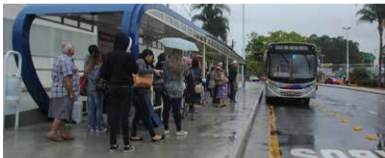
Nova plataforma do Centro diminui tempo de viagem de coletivos

Com um mês de funcionamento, a nova plataforma para embarque e desembarque de passageiros, situada entre as ruas Duque de Caxias e Campos Sales (Centro), já apresenta resultados positivos. Além de reduzir o volume de tráfego e desafogar o terminal central, o tempo de viagem dos ônibus que utilizam a baía, na avaliação da Coordenadoria de Transporte (órgão da Secretaria de Transporte e Mobilidade Urbana), diminuiu em média 20 minutos.