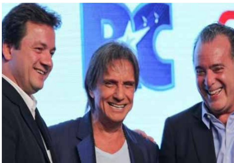
Roberto Carlos, com Wesley Batista, do JBS, e Tony Ramos, no início da campanha da Friboi:

Roberto Carlos e JBS, que tinham contratos de R$ 45 milhões, trocam farpas na Justiça paulista